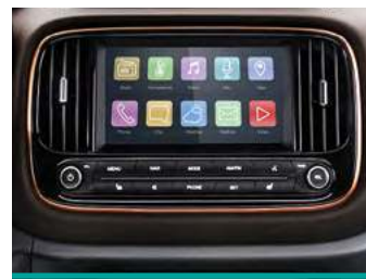
מסך מגע 8" בעברית הכולל: רדיו אינטרנטי, waze, פנגו, סלופארק