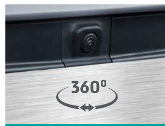
מצלמת 360 מעלות