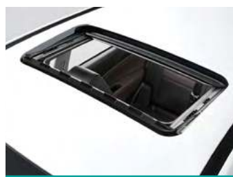
חלון שמש עם וילון אטימה מלאה