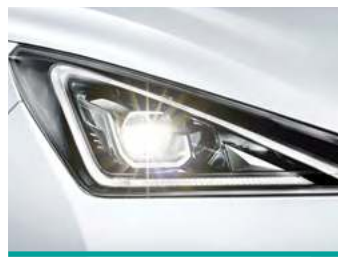
Full Led Technology הכוללת פונקציית Follow me home