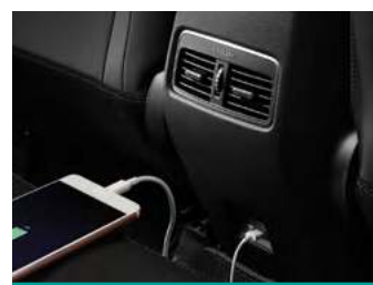
פתחי מיזוג מאחור כולל שקע USB