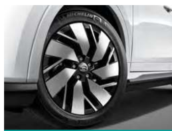
חישוקי סגסוגת קלה בקוטר 18"