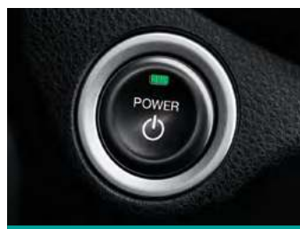
Keyless - כניסה והנעה ללא מפתח