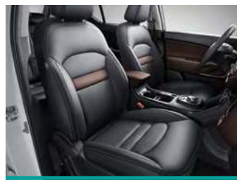
מושב עור, מושב נהג חשמלי, מושבים קדמיים מחוממים