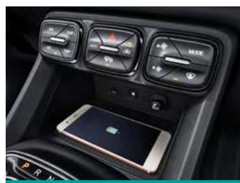
משטח טעינה אלחוטי לטלפון הנייד